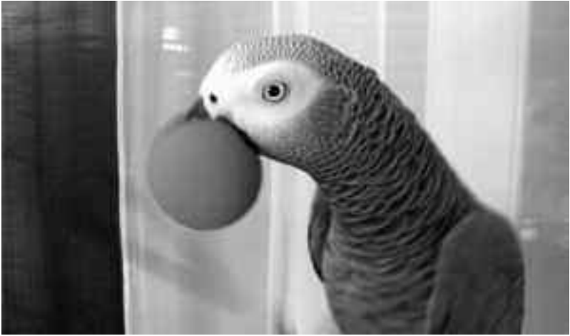
Psittacus erithacus clownatus

foi, semblent prendre le jeu très au sérieux. Ils savent rire et s'investissent complètement dans le jeu si celui-ci est réjouissant.